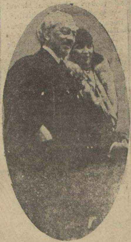
Sgurdeos B. ve refikası