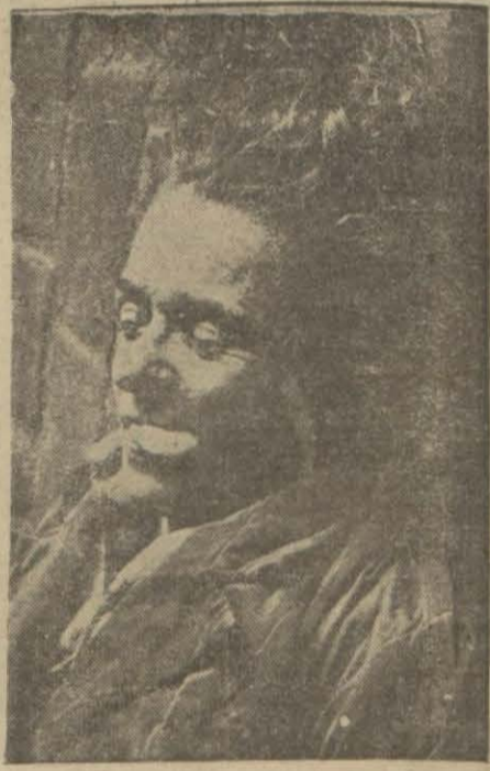
Bulunan kadın cesedi